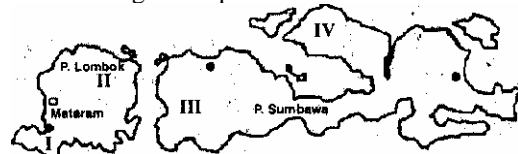
Nusa Tenggara Barat